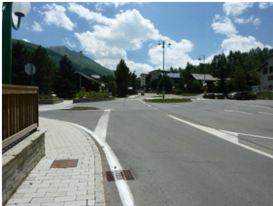
Tournez à gauche ici

100 mètres après le fait d'entrer dans Les Deux Alpes tournent à gauche dans la première rue, Route du Petit Plan.