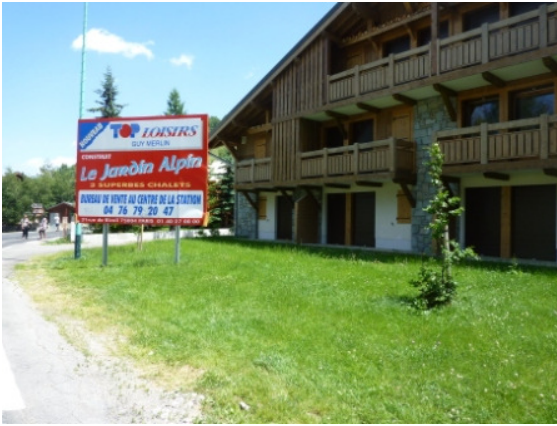
panneau d'affichage avant l'allée

Continuez en bas de cette rue pour 200 m. Sur votre droite vous verrez une publicité sur panneaux Le Jardin Alpin. L'allée pour le bâtiment est directement après ici, continuer aux parking devant le bâtiment, vous pouvez garer dans les endroits 7 et 13.