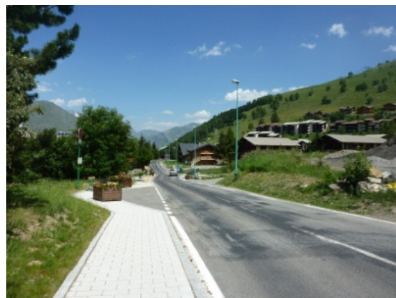
Route du Petit Plan

Percorrete questa strada per circa 200m, Le Jardin Alpin si trova sul lato destro, indicato da un grande tabellone pubblicitario. Subito dopo il tabellone svoltate a destra nel viale d'ingresso, troverete un ampio parcheggio di fronte allo chalet. Sul lato opposto del viale d'ingresso vi sono una fermata d'autobus e un Residence chiamato 'Le Goleon'