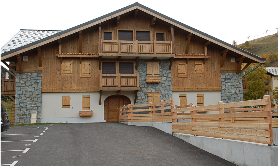
Il parcheggio a Le Jardin Alpin (posti auto n. 7 e 13)