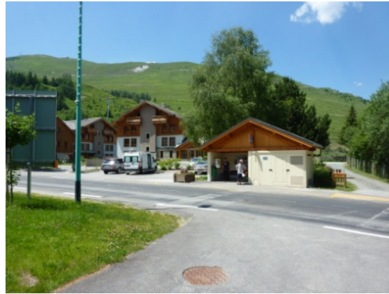
Tabellone poco prima del viale d'ingresso Fermata d'autobus di fronte al viale